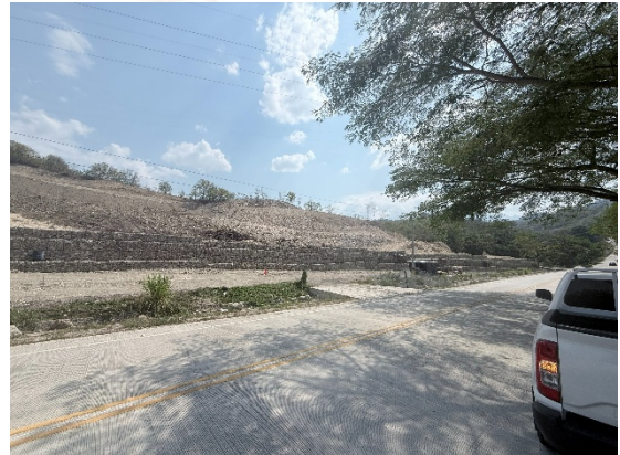
Se observa la calzada de la carretera en perfecto estado