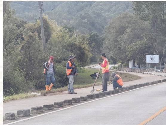
Se observa personal del contratista realizando limpieza de la calzada