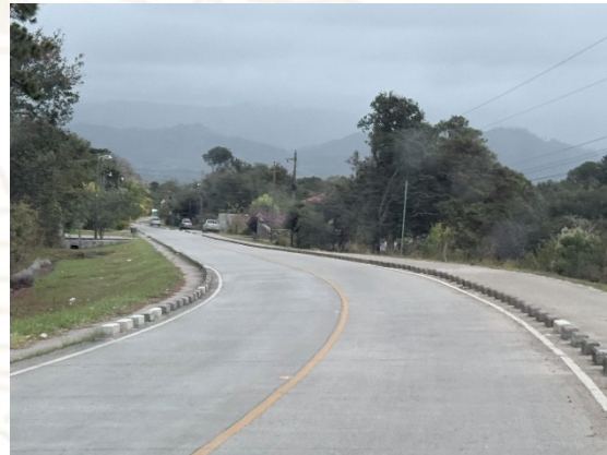
Se observa el inicio de la supervisión en tramo Gracias – Celaque