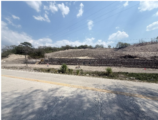
Muro de gaviones afectado por movimiento en zona de la falla km 77 el cual se encuentra siendo reforzado con nuevas secciones de gaviones a las partes del muro que se encontraban afectadas por los movimientos

Se recorrió el tramo por completo para inspeccionar detalladamente el mantenimiento satisfactorio del tramo y sus elementos.