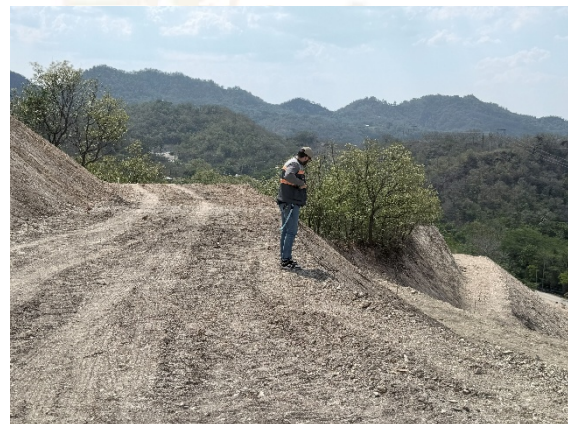
Se observa la parte alta del talud donde están realizando las bermas que forman parte del diseño de solución que están llevando a cabo