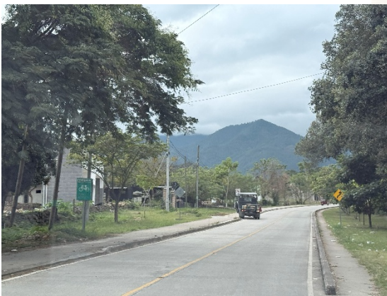
Se observa calzada completamente limpia y señalización en buen estado