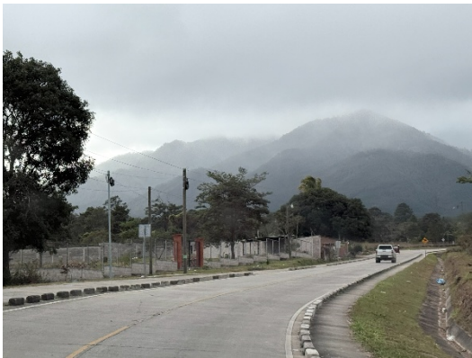
Se observa calzada, bordillos y señalización cumpliendo estándares de servicio

Se recorrió el tramo por completo para inspeccionar detalladamente el mantenimiento satisfactorio del tramo y sus elementos.