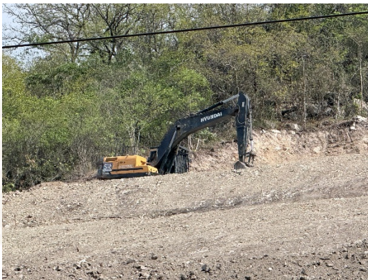
Se observa la excavadora trabajando en las bermas sobre el talud