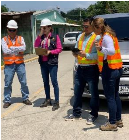
Colonia Sula Centro