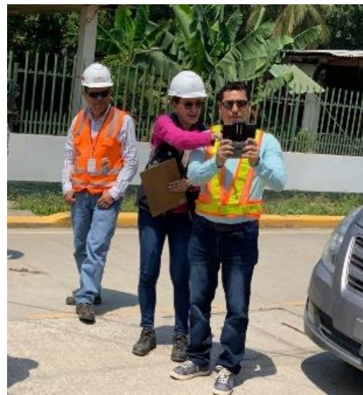
Colonia Oro Verde